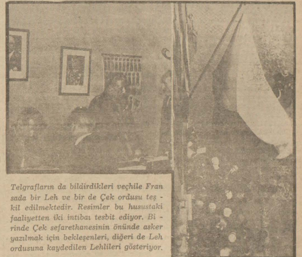
Telegfların da bildirdikleri vechile Fransada bir Leh ve bir de Çek ordusu teşkil edilmektedir. Resimler bu husustaki faaliyetten iki intibah tesbit ediyor. Birinde Çek sefarethanesinin önünde asker yazılmak için bekleyenleri, diğeri de Leh ordusuna kaydedilen Lehleri gösteriyor.

İngiliz filosu, Alman deniz filosunu Norveç sahillerinde harbe icbar etmek istedi, fakat Alman gemileri karanlıktan istifade ederek kaçtılar